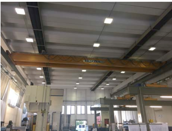
Nr° 2 Carri ponte da 15 Ton. Nr° 2 Overhead travelling cranes from 15 Tons.