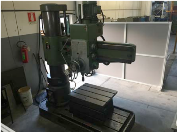
Trapano radiale INVEMA 50x2000. INVEMA radial drilling machine 50x2000.

Campo di lavoro : 50 x 2000 Working Area