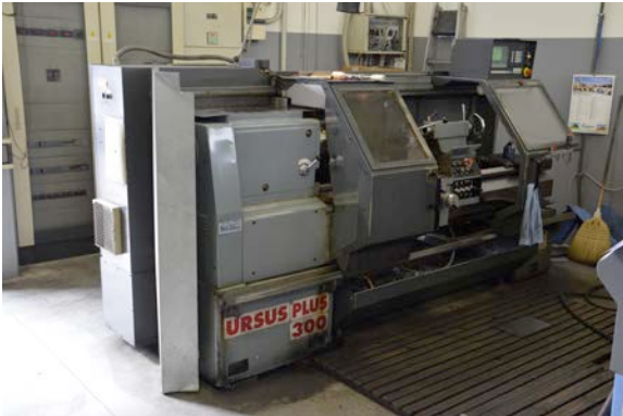
Tornio semi-automatico Ursus. Ursus semi-automatic lathe.