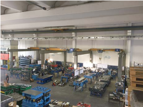
Nr° 3 Carri ponte da 4 Ton. Nr° 3 Overhead travelling cranes from 4 Tons.