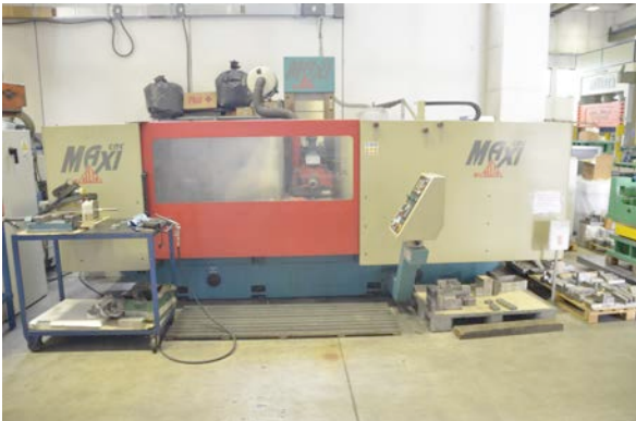
Rettifica tangenziale DELTA MAXI CNC. DELTA MAXI CNC ring-road grinding machine.

Campo di lavoro : 1800 x 750 Working Area