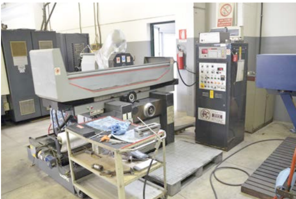
Rettifica tangenziale Fumagalli R.T.A.N.C. corse Fumagalli R.T.A.N.C. ring-road grinding machine

Campo di lavoro : 610 x 820 Working Area