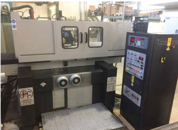
Rettifica tangenziale Fumagalli R.T.A.N.C. corse Fumagalli R.T.A.N.C. ring-road grinding machine

Campo di lavoro : 1800 x 750 Working Area