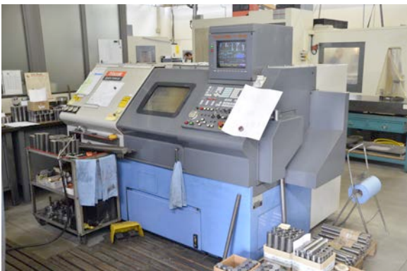
Tornio parallelo Mazak CNC. Mazak CNC parallel lathe.