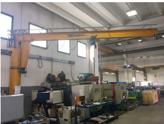
Nr° 1 Carri ponte da 1 Ton. Nr° 1 Overhead travelling cranes from 1 Tons.

ento: Via dell'Artigianato, 21 – 35010 Pieve di Curtarolo (PD) Tel. 00 39 049 9620 595 • 00 39 049 9624 192– Fax 00 39 049 9620 589 – C.F. e P. IVA 03558500280 http://www.lames.it • E-Mail: info@lames.it