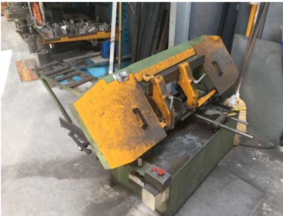
Seghetti a nastro. Band saws.

Campo di lavoro : 50 x 2000 Working Area